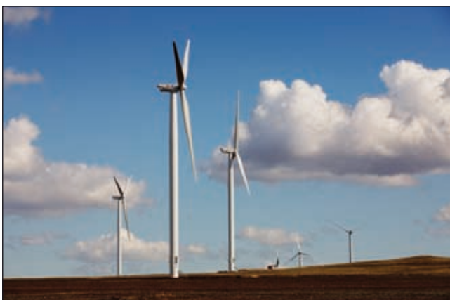
Bild 4: CEZ-Windpark – Fantanele, Kreis Constanta, Baujahr 2009–2010

erster ausländischer Investor produziert seit kurzem mono- und polykristalline Photovoltaik-Module im Kreis Satu Mare. Eine erste eigene 1-MWp-Anlage steht in Südrumänien vor der Inbetriebnahme. Die zweite MW-Anlage steht vor der Realisierung. Wenn in den letzten Jahren in Rumänien die PV-Anlagen in kW-Tempo gebaut wurden (siehe Tabelle), so befinden sich ab 2010 viele Anlagen aus der MW-Klasse in der Realisierung oder Planungsphase.