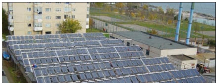
Bild 3: Nahwärmeversorgung in Mangalia, Kreis Constanta – 360 Vakuumröhrenkollektoren, die ca. 210 MWh/Jahr produzieren und damit ca. 70% des Wärmebedarfs übernehmen können, Baujahr 2005

Dies ist Aufgabe der Nationalbehörde zur Energieregulierung (ANRE – Agentia Nationala de Reglementare Energetica). Es fehlt noch das Einverständnis der Europäischen Kommission, da das Gesetz als Staatshilfe gilt.