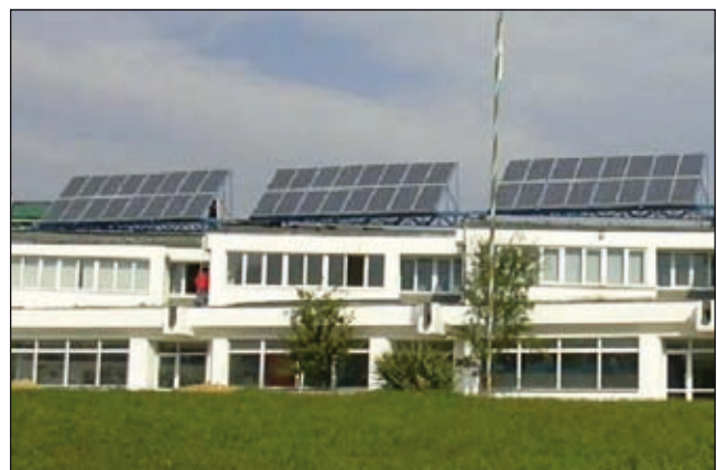
Bild 5: Die 10 kWp netzgekoppelte PV-Anlage auf dem Dach der Transilvania-Universität in Brasov (Kronstadt), Baujahr 2007